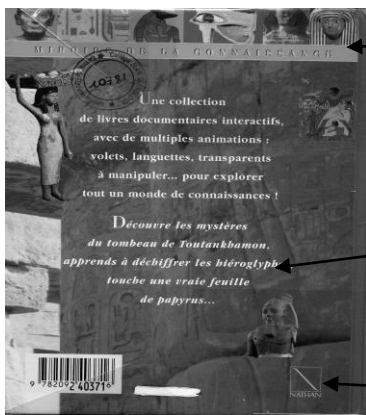
Quatrième de couverture